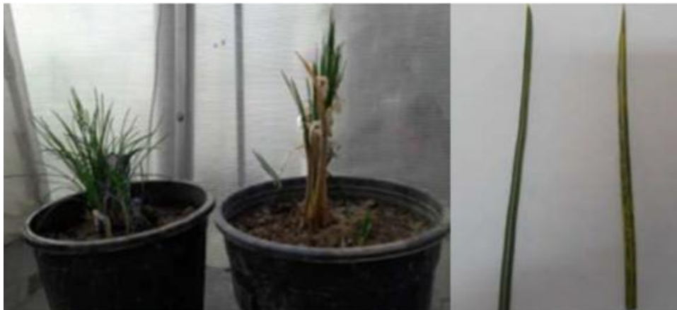
شکل ۷- علائم موزائیک (راست) و کندگی رشد (چپ) در بانه‌های زعفران آلوده به ویروس

ویروس‌هایی از جمله Bean yellow mosaic، Narcissus mosaic virus، Cucumber mosaic virus و Iris severe mosaic virus، Turnip mosaic virus، Saffron latent virus در طبیعت زعفران را آلوده می‌کنند. بوته‌های آلوده به ویروس علائمی مانند موزائیک، زردی و کندگی رشد را نشان می‌دهند (شکل ۷). هر چند در بیشتر موارد آلودگی به ویروس‌ها در زعفران به صورت نهفته بوده و علائم ماکروسکوپی تولید نمی‌کنند. این ویروس‌ها در زعفران‌کاری‌های ایران گسترش وسیعی دارند. ویروس‌های زعفران بوسیله شته و بانه‌های آلوده منتقل می‌شوند. بعلاوه بانه‌های آلوده امکان بقای ویروس در زمان خواب ظاهری و حقیقی بوته‌ها را فراهم می‌کنند. علاوه بر کاهش کمی محصول، آلودگی به ویروس موجب کاهش کیفیت زعفران تولیدی نیز می‌شود. همچنین عقیده بر این است که علایمی مانند پیچیدگی و بدشکلی کلاله زعفران و تورم بانه زعفران نیز ناشی از بیماری‌های ویروسی زعفران هستند (شکل ۸).