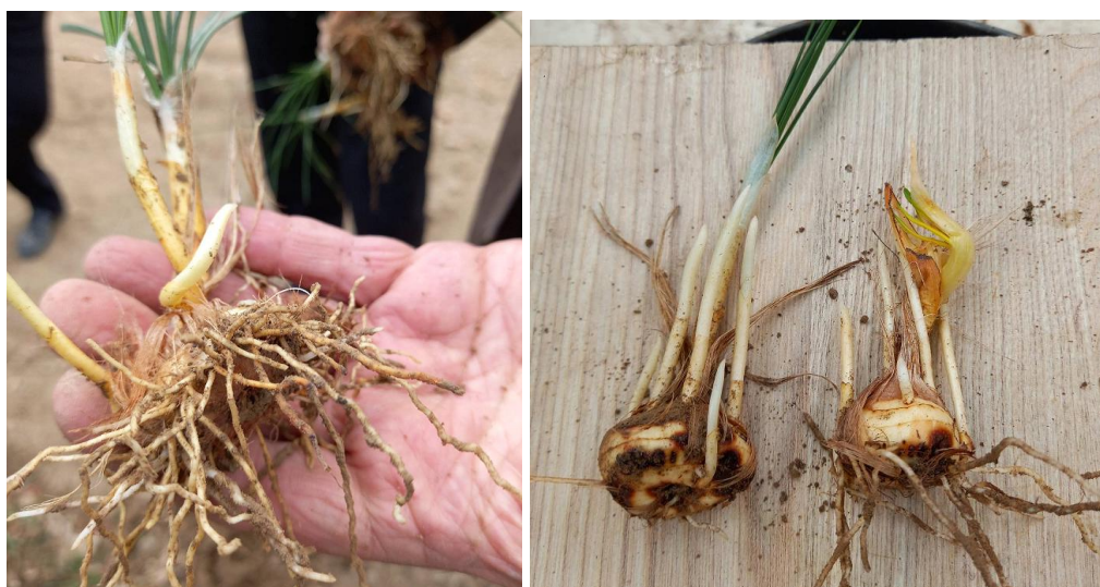
شکل ۲- بنه زعفران آلوده به کنه (سمت راست) در مقایسه با بنه زعفران سالم (چپ)

در صورت فراهم شدن شرایط زیستی که در بالا ذکر شد، کنه، بنه زعفران را غالباً از محل زخم‌ها و گاهی قسمت‌های سالم مورد حمله قرار می‌دهد، سپس ضمن تغذیه و ایجاد تونلی در بنه در داخل تونل شروع به زاد و ولد کرده و حفره‌ای به رنگ سیاه در بنه ایجاد می‌کند. این حفره بتدریج گسترش یافته و عواملی مانند انواع قارچ‌ها و باکتری‌های ساپروفیت به راحتی از محل زخم‌ها و حفرات به داخل بنه نفوذ کرده و باعث تسریع در پوسیدگی بنه‌ها می‌شود. از عوارض فعالیت این کنه، باریک و کوتاه شدن برگ‌های زعفران آلوده نسبت به بوته‌های سالم و همچنین خزان زودتر از معمول بوته‌های آلوده می‌باشد (شکل ۲). همچنین مشاهده شده است در بوته‌های بسار آلوده نواقصی در گل نظیر کم‌رنگ شدن گلبرگ‌ها، ریز شدن و پیچیدگی کلاله بوجود می‌آید. بنابراین خسارت کلی این آفت پس از چند سال، تنک شدن مزرعه و کاهش محصول می‌باشد.