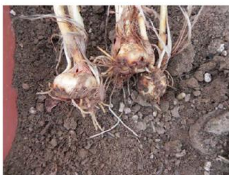
شکل ۴- سوختگی و پوسیدگی قسمت تحتانی پیاز، نکروزه و قرمز شدن برخی جوانه‌های نورسته، بدشکلی و ایجاد ساقه‌های بی‌جا در زعفران آلوده به بیماری باکتریایی