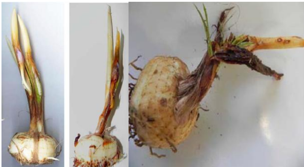
شکل ۳- لهیدگی و پوسیدگی چمچمه (راست) و عدم بیرون آمدن گل از غلاف و از بین رفتن تدریجی اندامهای گل در زیر خاک آلوده به بیماری باکتریایی (چپ)