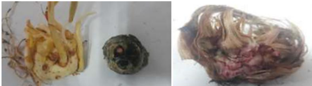
شکل ۶- علائم پوسیدگی بنه زعفران در اثر آلودگی به قارچ Fusarium solani (راست) و قارچ Aspergillus niger (چپ)

در بین بیمارگرهای گیاهی، قارچ‌های Rhizoctonia crocorum ، Fusarium solani ، Fusarium و Pythium ultimum ، Fusarium pallidoroseum ، Fusarium sp ، Fusarium moniliforme ، oxysporum و Macrophomina phaseolina از عوامل ایجاد پوسیدگی ریشه و بنه زعفران هستند که بوسیله بنه آلوده در مزارع پخش می‌شوند. این قارچ‌ها در خاک نیز دوام زیادی داشته و کنترل آن‌ها در مزارع آلوده زمانبر است. همچنین قارچ‌های Aspergillus niger ، Penicillium digitatum و Rhizopus stolonifera از عوامل پوسیدگی بنه‌ها در مزرعه و انبار هستند. مزارع آلوده به این قارچ‌ها گلدهی مناسبی نداشته و اغلب بنه‌ها سبز نمی‌شوند و عمر اقتصادی مزرعه به شدت کاهش می‌یابد. در بنه‌های آلوده ریشه‌ها دارای پوسیدگی هستند (شکل ۶). در مواردی بدشکلی گل‌ها نیز مشاهده شده است. خسارت Fusarium solani در مزرعه به تنهایی تا نوبدی ۵۰ درصد از بنه‌ها می‌رسد و در برهم کنش با نماتد Dtylenchus sp. خسارت آن افزایش یافته و تا ۶۰ درصد از بنه‌ها از بین می‌روند.