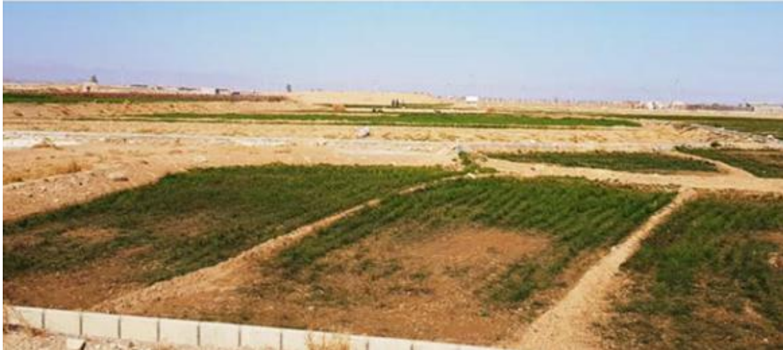
شکل ۵- عدم خروج برگ از خاک و تنک شدن مزرعه زعفران آلوده به بیماری باکتریایی